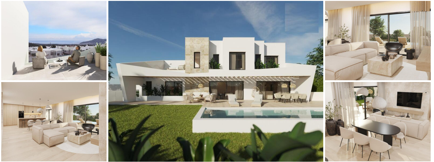
VILLA NEUVE A POLOP

Villa moderne de construction neuve à Alberca, Polop, avec une vue magnifique sur la montagne et la mer.