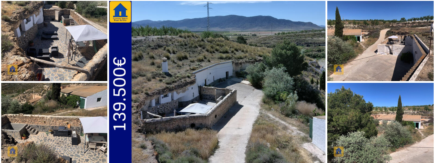
Cueva Elena - La Alqueria

Cette propriété est une perle rare ! Située en bordure du charmant et tranquille hameau de La Alquería, vous achèterez non seulement une grande et belle maison troglodyte réformée avec un vaste patio privé ombragé, mais aussi deux grottes non réformées, une grande grange et un terrain suffisamment grand pour y installer un potager et bien d'autres choses encore ! De plus, si vous avez besoin de plus de grottes non aménagées, pour le tourisme par exemple, ou d'un terrain, la propriété voisine est également disponible à l'achat.