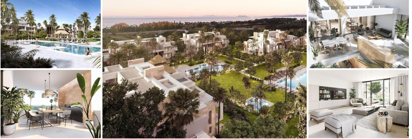
Penthouse de 3 Chambres à la Nouvelle Mille d'Or

Découvrez une communauté tropicale exclusive composée de 140 résidences et penthouses, redéfinissant le concept de luxe à Estepona. Ce projet présente une architecture emblématique créée par le studio primé Villarroel Torrico. Les vastes habitations offrent des intérieurs spacieux, des terrasses privées et des solariums sur le toit, offrant un style de vie sophistiqué et relaxant.