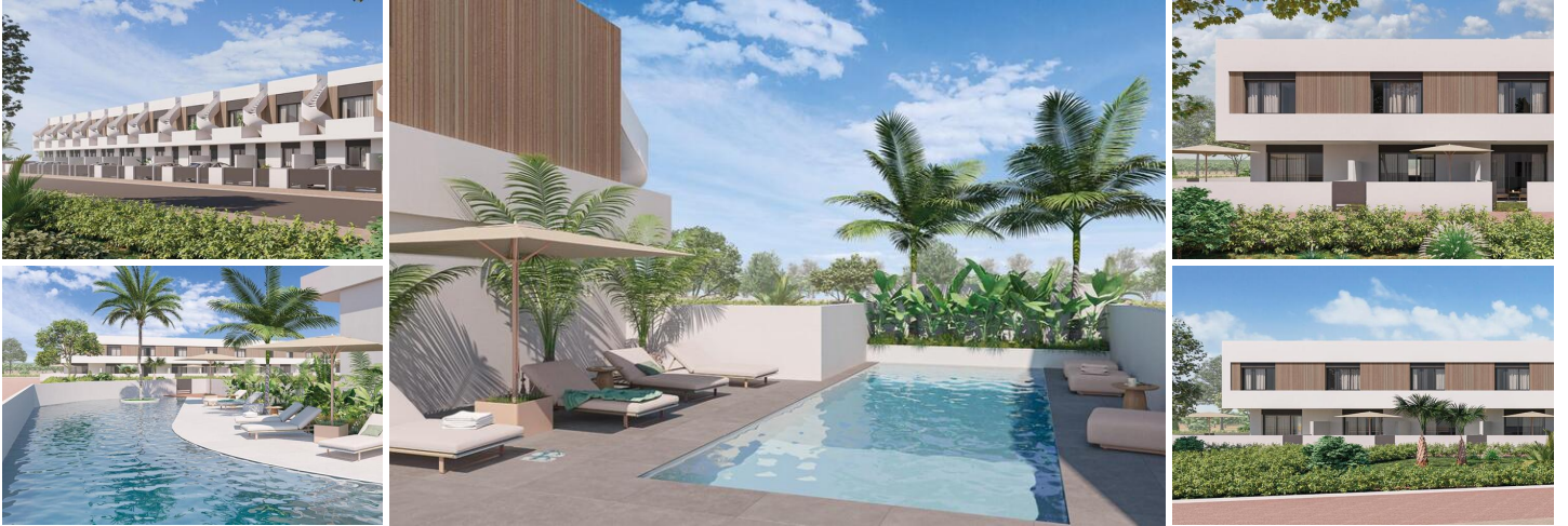
Casas adosadas y casas adosadas en esquina de nueva construcción en Pilar de la Horadada