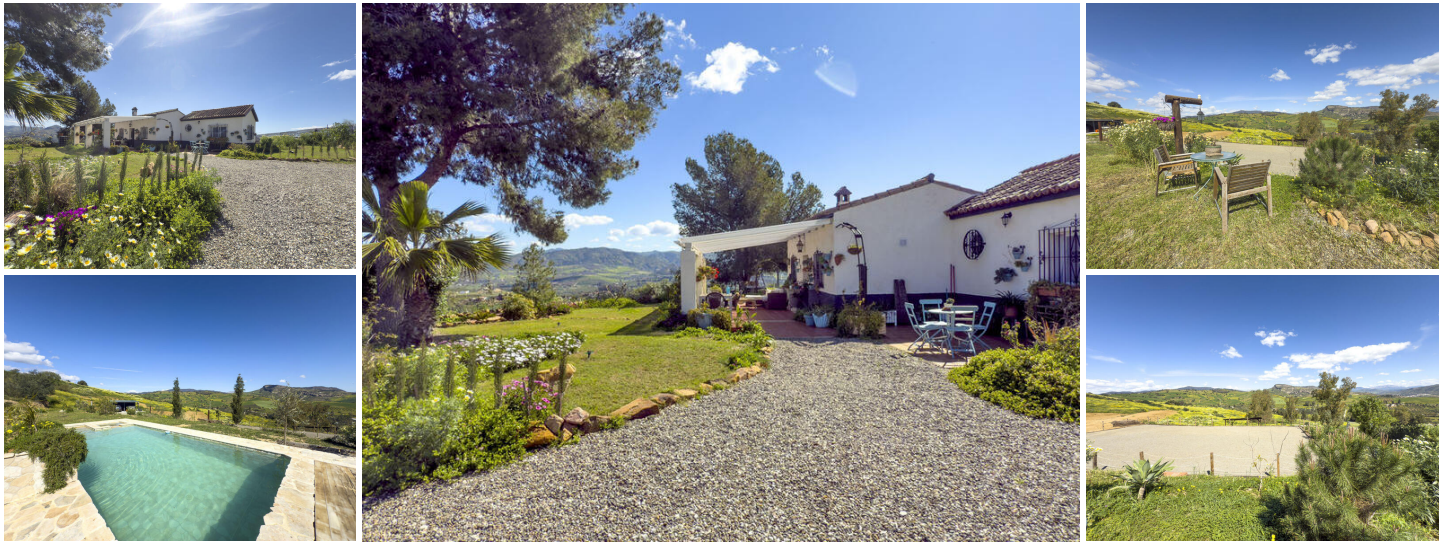
Finca Ecuestre con Impresionantes Vistas a la Montaña – Zona de Álora/Pizarra

Enclavada en la pintoresca campiña cerca de Álora y Pizarra, esta finca ecuestre ofrece una combinación única de comodidad, funcionalidad y belleza natural. Ubicada en un terreno vallado de aproximadamente 20.000 m 2 , la finca es ideal para los amantes de los caballos, con establos, una pista de entrenamiento y acceso directo a fantásticas rutas de equitación.