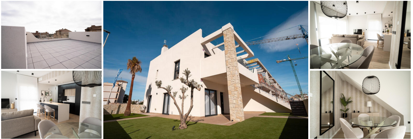
Bungalows de obra nueva en Pilar de la Horadada