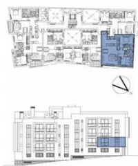
APARTAMENTO B 2 DORMITORIOS PLANTA SEGUNDA