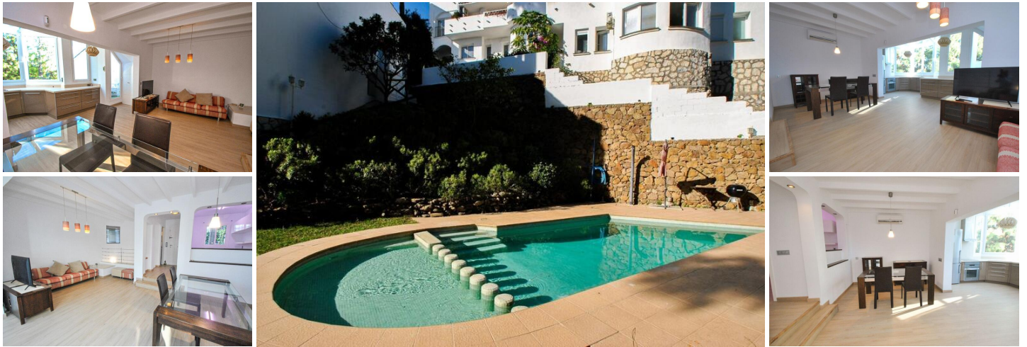
Villa renovada en Calahonda con piscina, jardín y azotea

Esta villa independiente totalmente renovada en la parte baja de Calahonda está a solo 20 minutos a pie de los servicios locales y a otros 10 minutos de la playa. Presenta un diseño moderno, grandes ventanales que dejan entrar mucha luz natural y una entrada privada que conduce a un patio delantero.