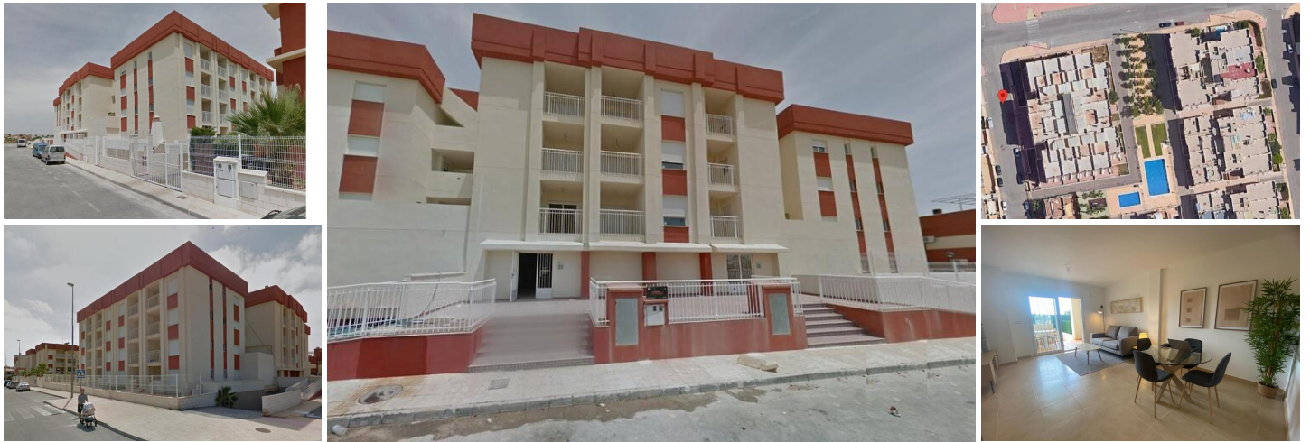
Complejo Residencial Regenerado en Lomas de Cabo Roig - Apartamentos Reformados