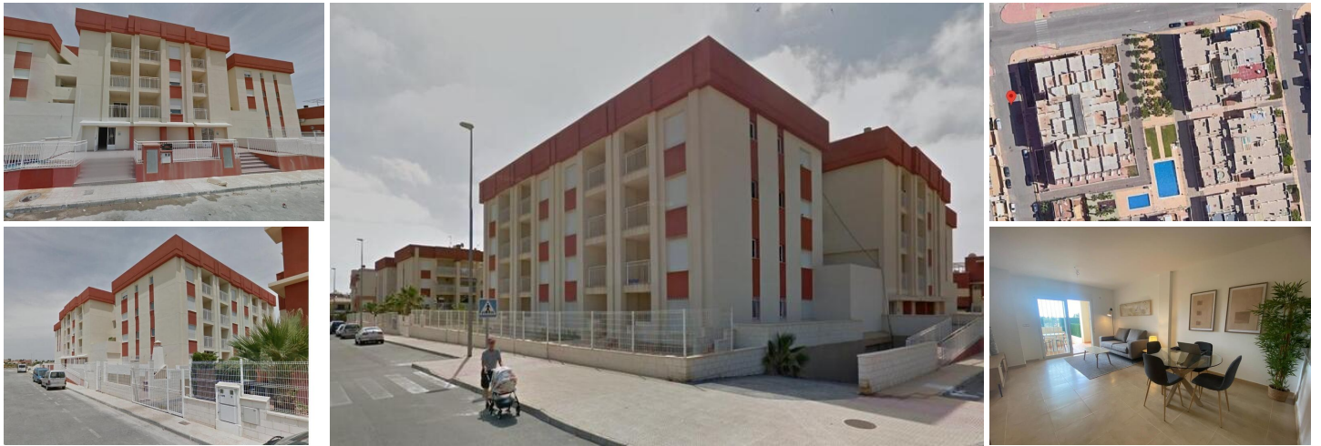
Complejo Residencial Regenerado en Lomas de Cabo Roig - Apartamentos Reformados