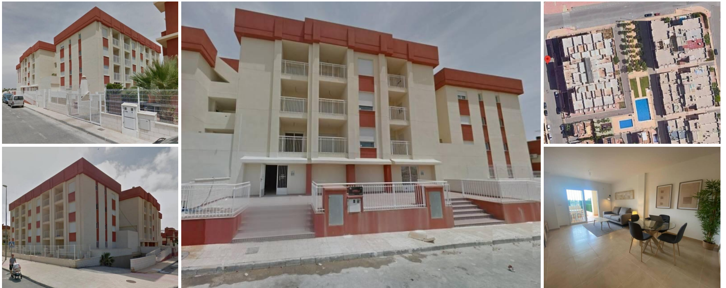
Complejo Residencial Regenerado en Lomas de Cabo Roig - Apartamentos Reformados