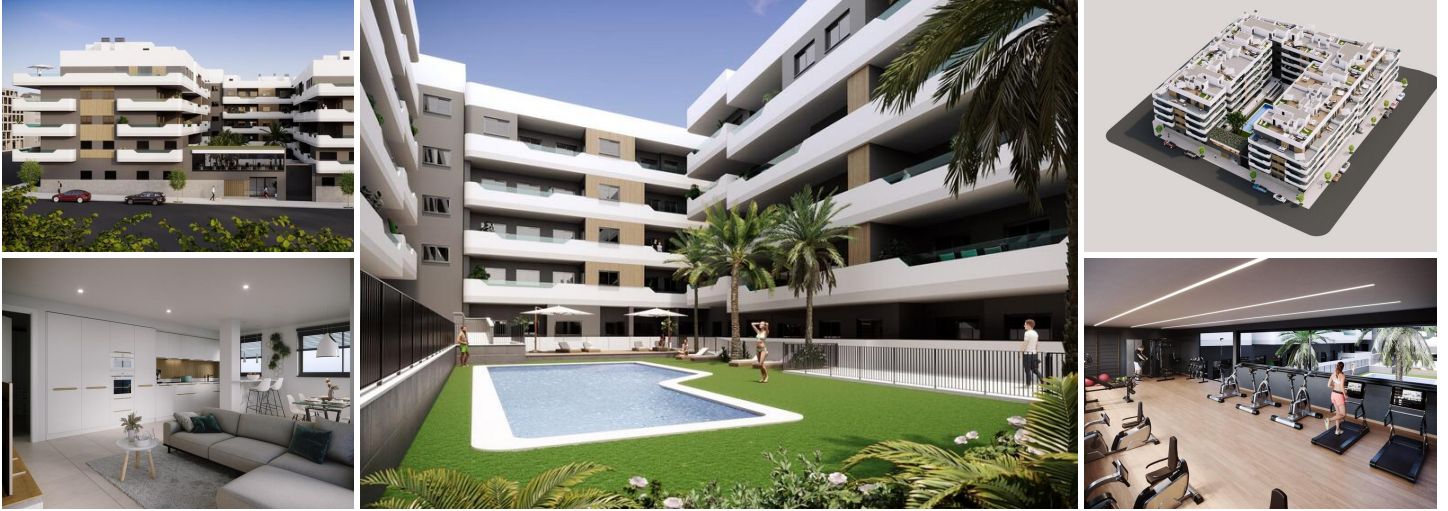
Complejo residencial de obra nueva en santa pola

Moderno residencial cerrado compuesto por viviendas de 1, 2 y 3 dormitorios y 2 baños completos. El complejo está formado por 4 escaleras de apartamentos con amplias zonas comunes ajardinadas, que incluyen piscina, zona de relax y gimnasio.