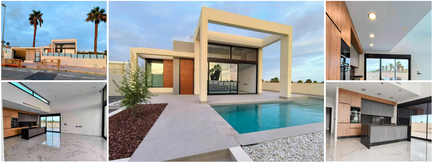
Villa de obra nueva en rojales

Villa moderna de obra nueva en Doña Pepa, Rojales.