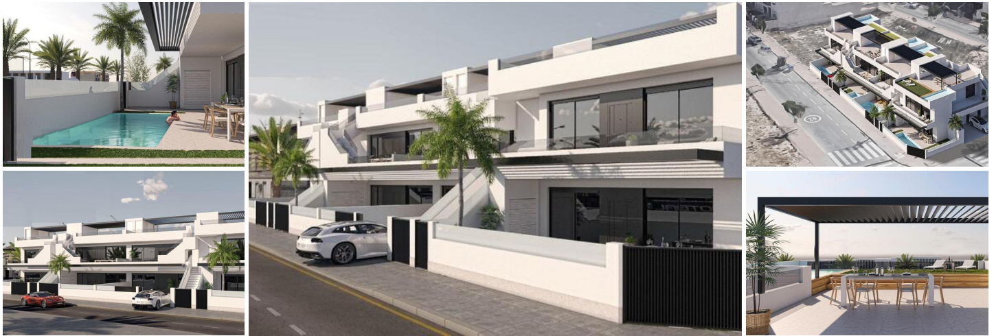
Bungalows de obra nueva en san pedro del pinatar

Nuevo complejo residencial de bungalows de 3 dormitorios en San Pedro del Pinatar.