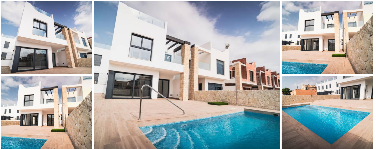
Bungalows y chalets de obra nueva en Pilar de la Horadada