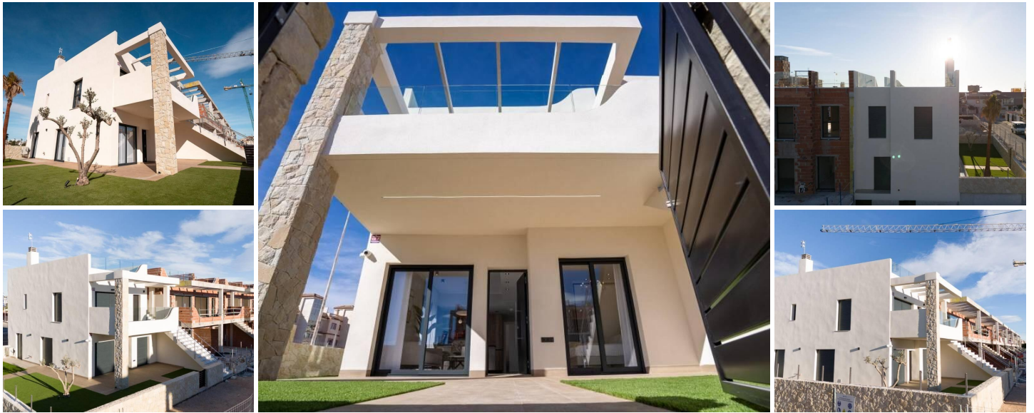
Bungalows de obra nueva en Pilar de la Horadada