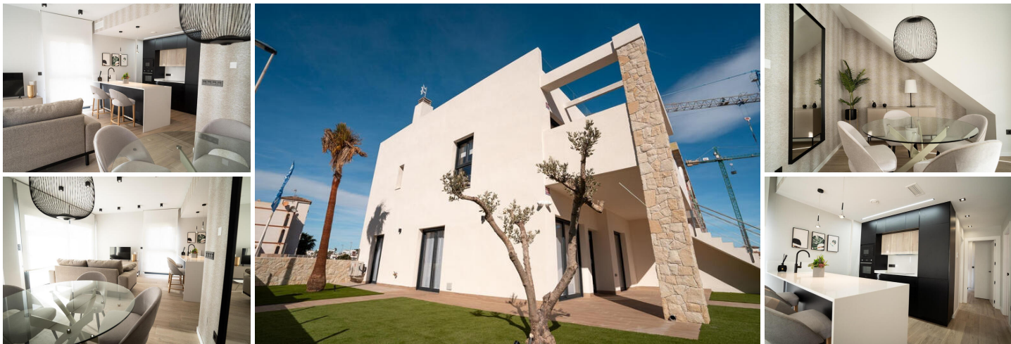
Bungalows de obra nueva en Pilar de la Horadada