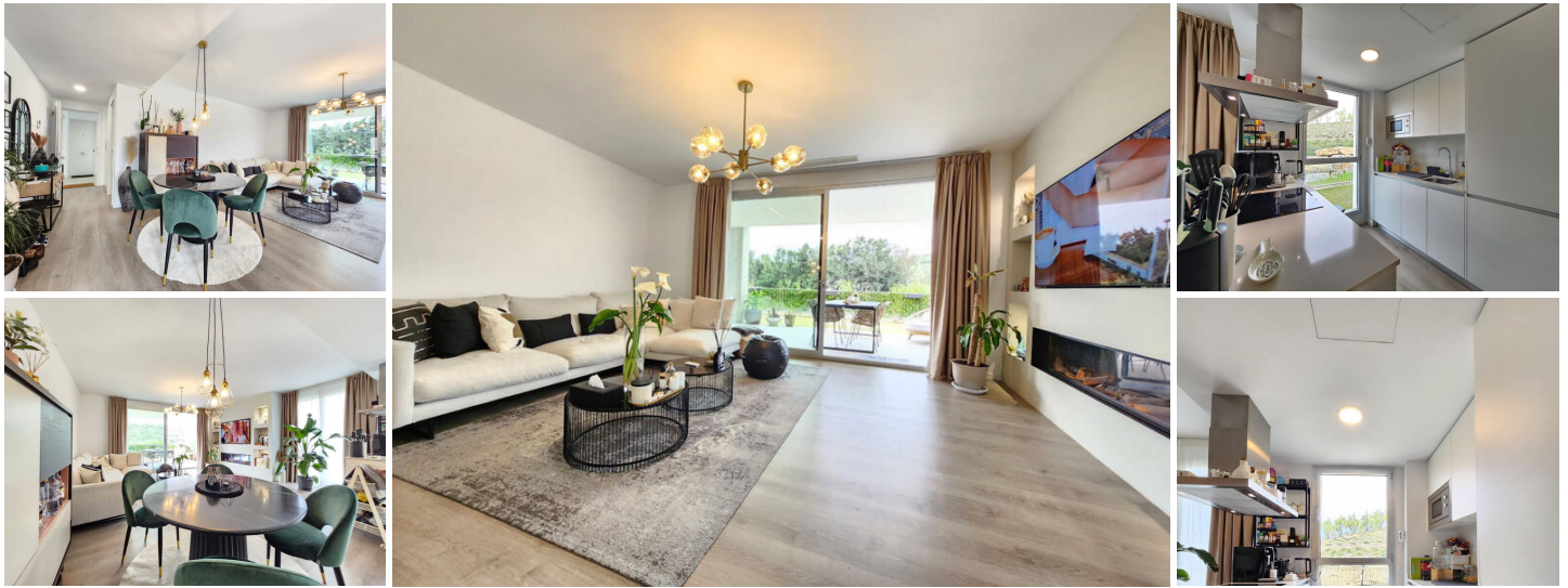
Planta Baja en Estepona

Este impresionante piso de planta baja, ubicado en exclusiva urbanización en Estepona, es una auténtica joya que combina diseño moderno, comodidad y una ubicación inmejorable. Construido en 2021, esta vivienda destaca por su decoración y mobiliario de gusto exquisito, cuidando hasta el más mínimo detalle para ofrecer un ambiente elegante y acogedor.