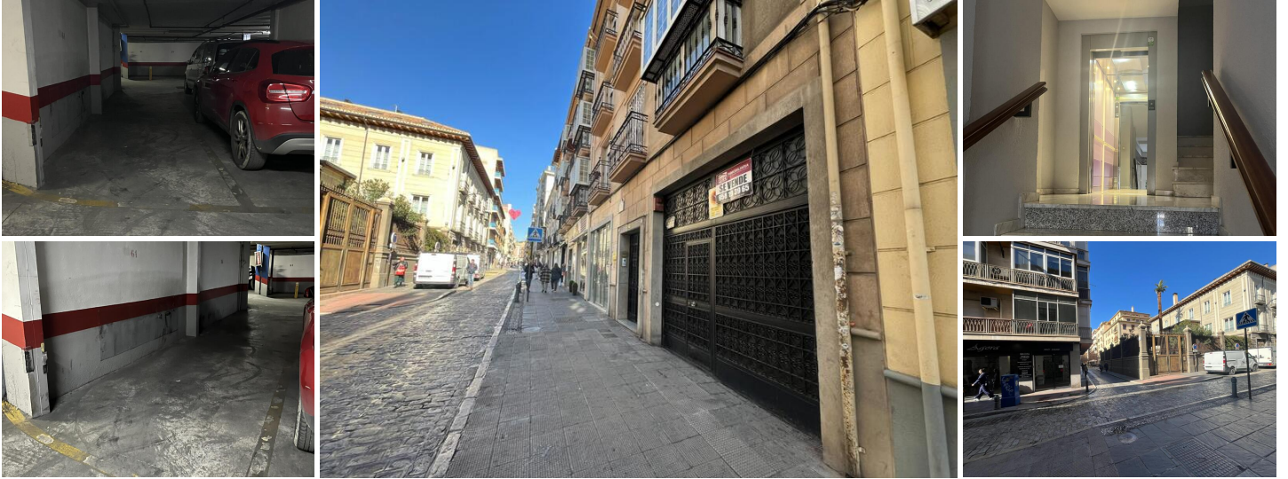
Garaje en venta en calle San Antón 45. Planta -2. Ascensor. Medidas: 4,70 metros x 2,20 metros.