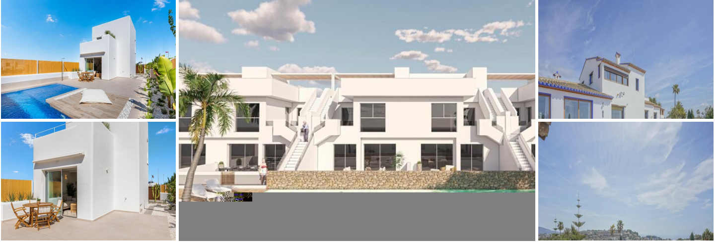
Complejo Residencial de Bungalows de Obra Nueva en Pilar de la Horadada