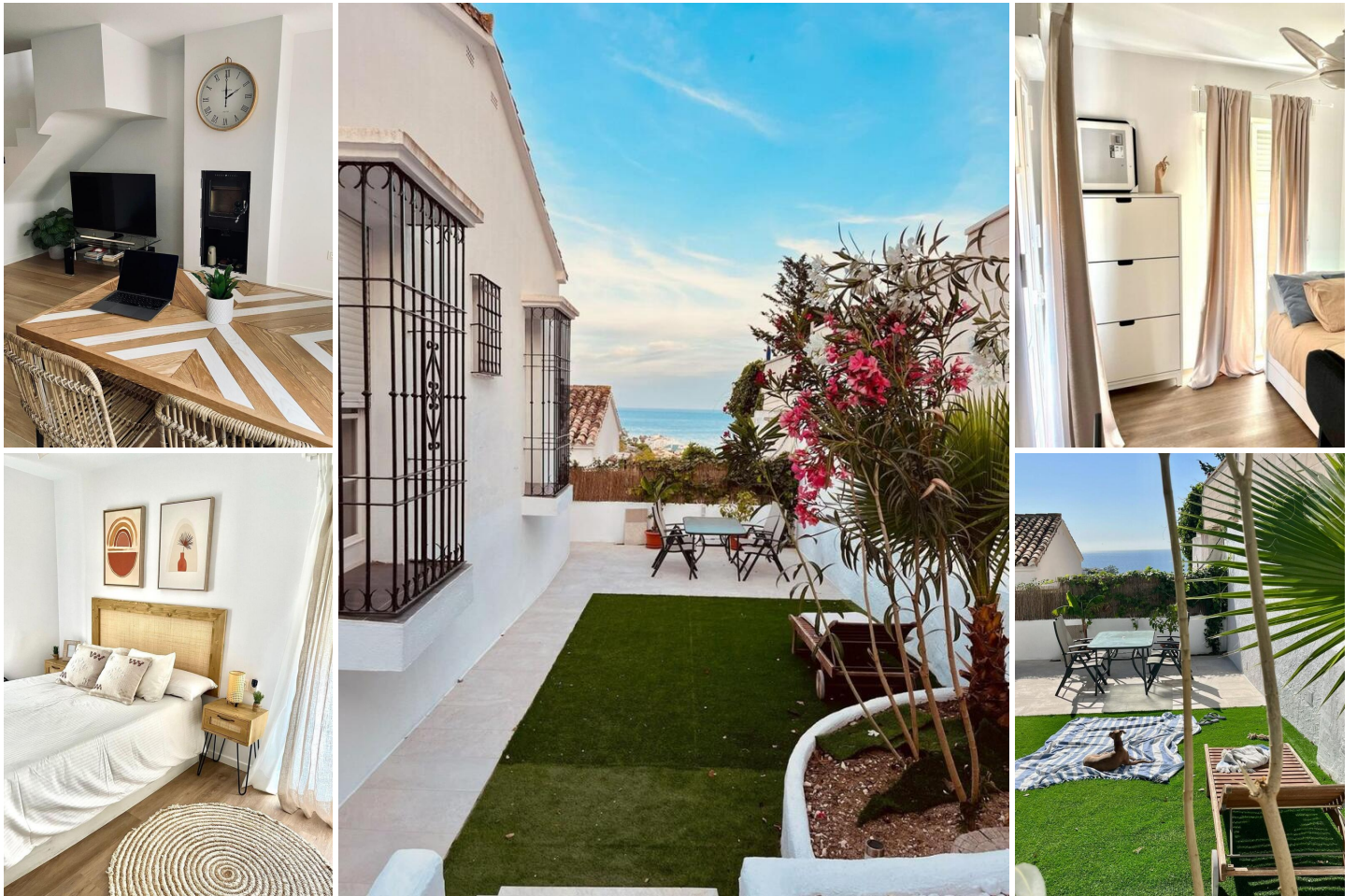
Encantadora Casa Adosada en Benalmádena