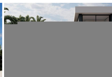
VILLA DE OBRA NUEVA EN ROJALES

Villa moderna de nueva construcción en Rojales cerca de todas las comodidades y servicios.