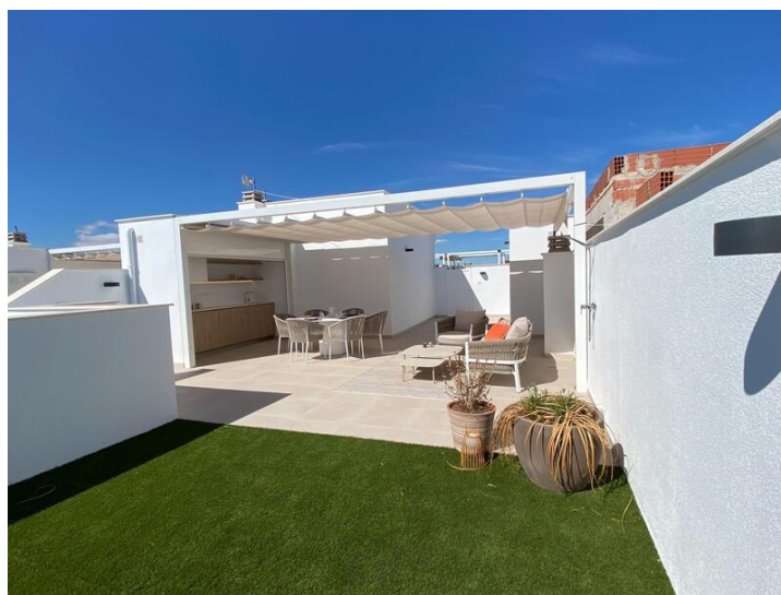
Nieuwbouw Bungalow Wooncomplex in Pilar de la Horadada