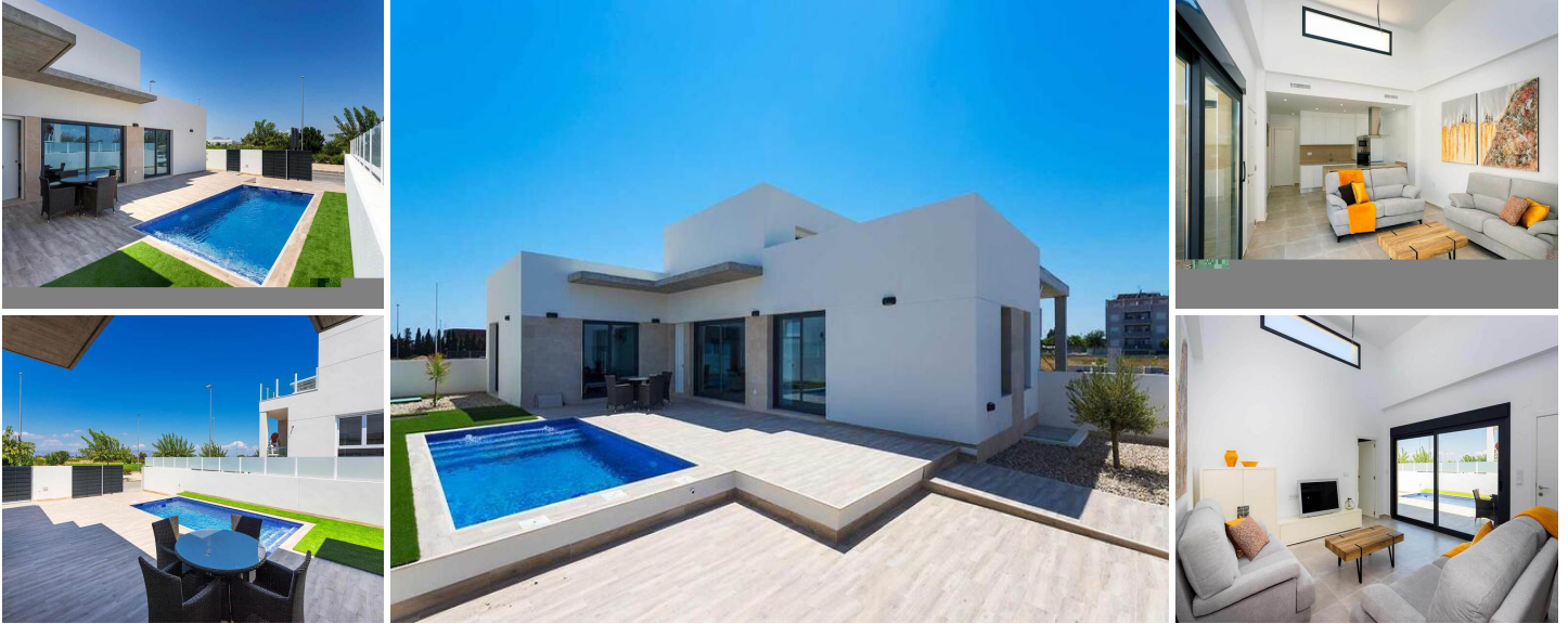
Neubau-Wohnanlage in Los Alcazares

Los Alcázares ist ein idyllischer Ort für diejenigen, die in eine neue Wohnimmobilie an der Costa Cálida investieren möchten. Nur 25 Minuten vom Flughafen Murcia und ca. 55 Minuten vom Flughafen Alicante entfernt, ist diese Gegend über die Autobahn bequem mit den großen Städten wie Cartagena, Murcia und Alicante sowie mit anderen schönen Stränden an der Costa Cálida und der Costa Blanca verbunden.