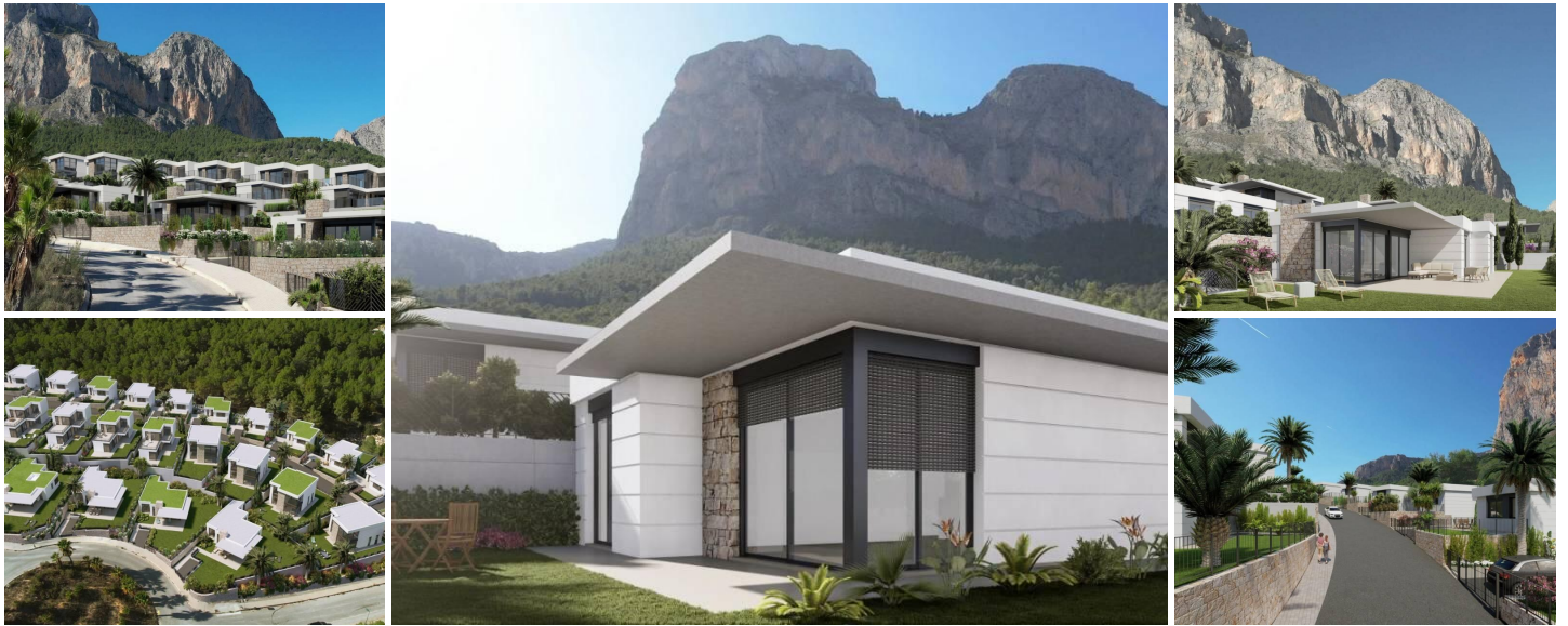
Chalets de Nueva Construcción en Polop, Alicante