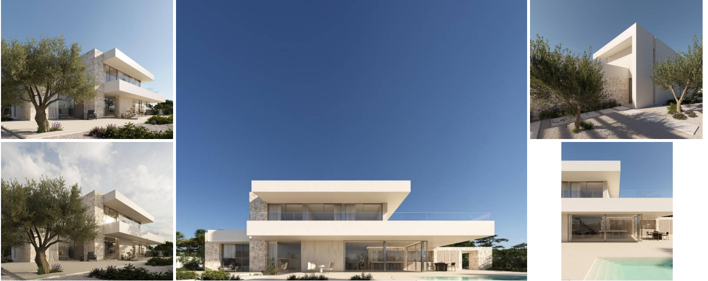
VILLA DE OBRA NUEVA EN MORAIRA

Villa de obra nueva en Moraira situada en la conocida zona de L'Andragó. Se encuentra a tan solo 350m de la cala del Andragó y a unos 200m del paseo marítimo junto a la carretera que lleva a Moraira y los diferentes comercios y restaurantes, todo muy cerca.