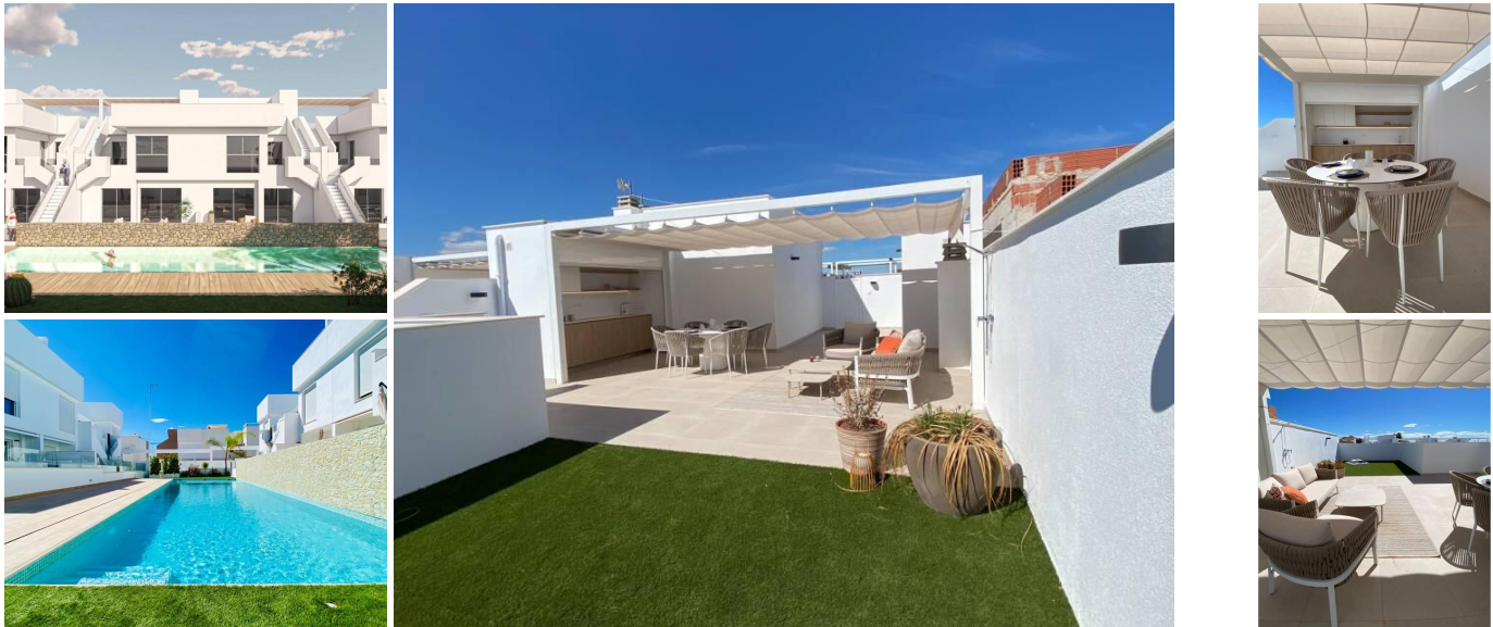
Complejo Residencial de Bungalows de Obra Nueva en Pilar de la Horadada