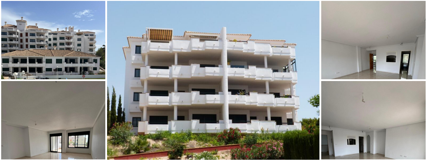
Apartamentos Llave en Mano en Venta en Lomas de Campoamor, Orihuela Costa

Descubra el exclusivo complejo residencial Lomas de Campoamor