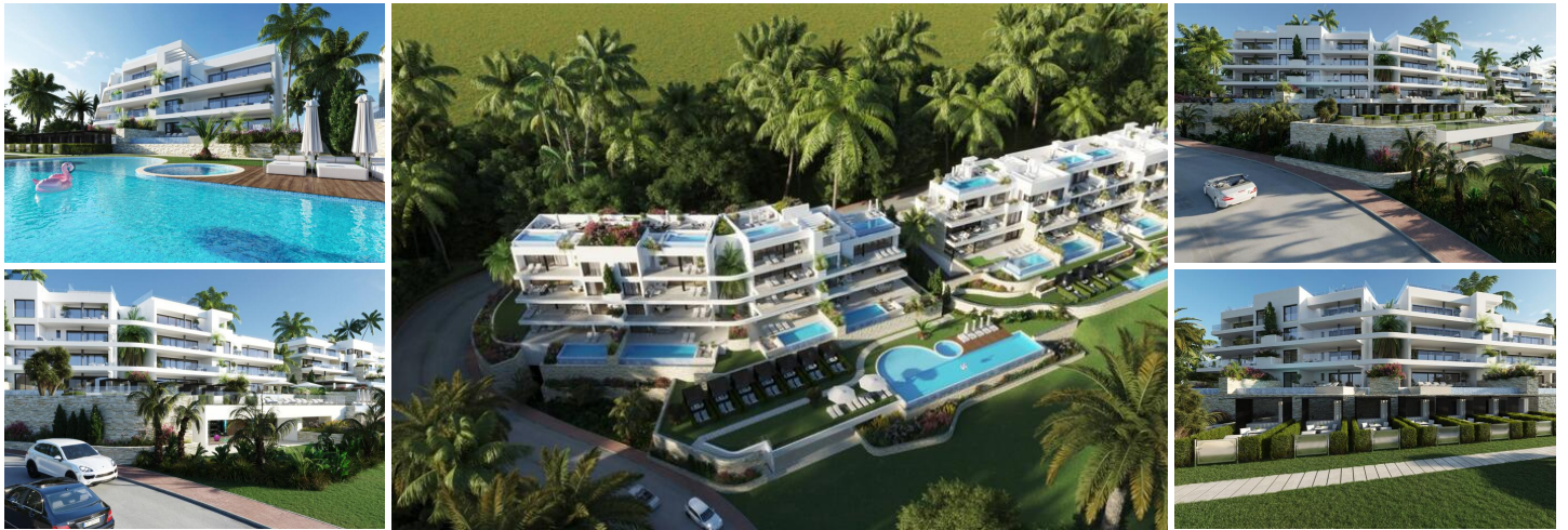
COMPLEJO RESIDENCIAL DE OBRA NUEVA EN LAS COLINAS GOLF

La promoción de obra nueva consta de 15 apartamentos de lujo con enormes terrazas con vistas a la zona verde natural circundante.