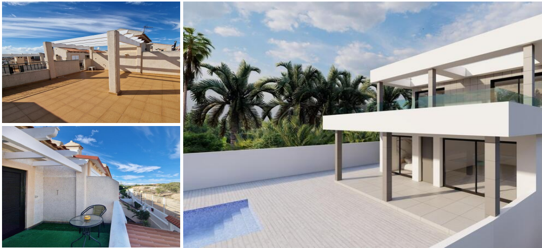
VILLA DE OBRA NUEVA EN ROJALES

Villa moderna de nueva construcción en Rojales cerca de todas las comodidades y servicios.