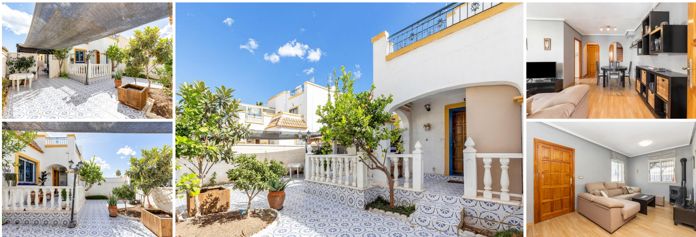
Vivienda adosada en Jardín del Mar, Torrevieja

Propiedad de 3 dormitorios, 2 baños, salón-comedor, cocina independiente, terraza y solárium privado.