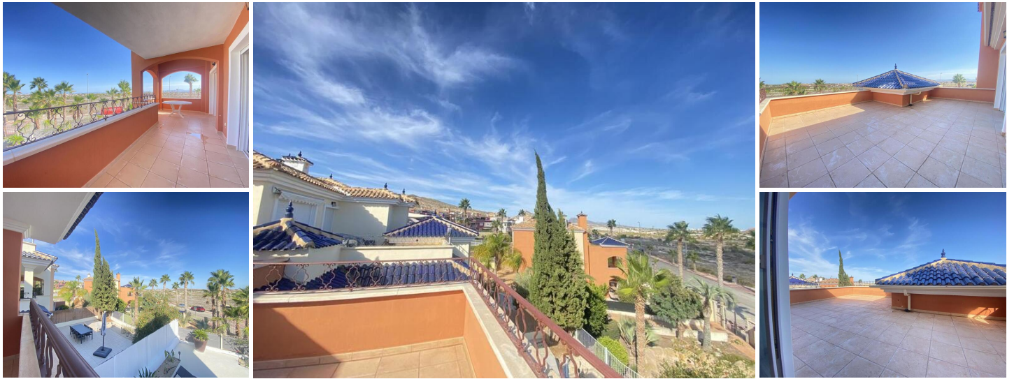
Apartamento Duplex de Dos Plantas en Altaona Golf

Este amplio y luminoso apartamento dúplex de dos dormitorios está situado en la prestigiosa urbanización Altaona Golf. El diseño de planta abierta incluye una moderna cocina americana que fluye perfectamente en la sala de estar. Grandes puertas correderas conducen a una amplia terraza, mientras que un lavadero y aseo de invitados también están convenientemente situados en la planta baja.