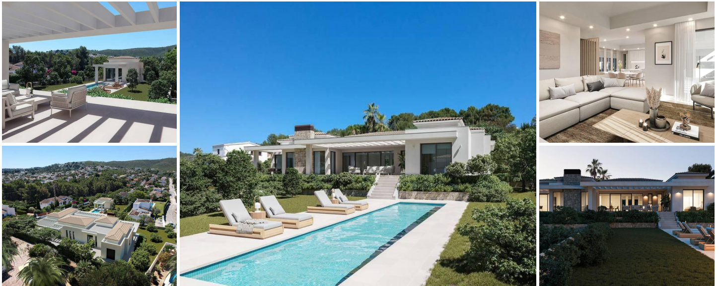
VILLA DE OBRA NUEVA EN JAVEA

La parcela de 1741 m2 se encuentra a menos de 5 minutos en coche de la playa de Jávea y está convenientemente situada a corta distancia en coche de otros servicios como supermercados, restaurantes y colegios internacionales.