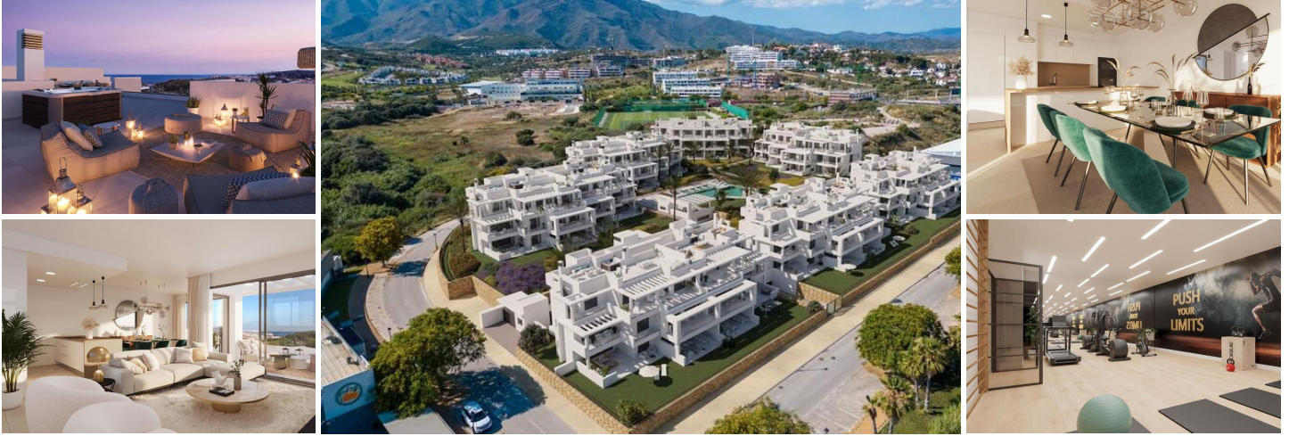
Ático en venta en Guadalobón, Málaga

Ático Moderno con Terrazas y Solárium con Vistas al Mar (3 dormitorios + 2 baños). Ubicada en un complejo residencial cerca de la playa en el oeste de Estepona, esta propiedad ofrece un estilo de vida deseable en la cotizada Costa del Sol. Disfrute de un ambiente relajado, playas naturales, campos de golf y nuevos atractivos de la zona.