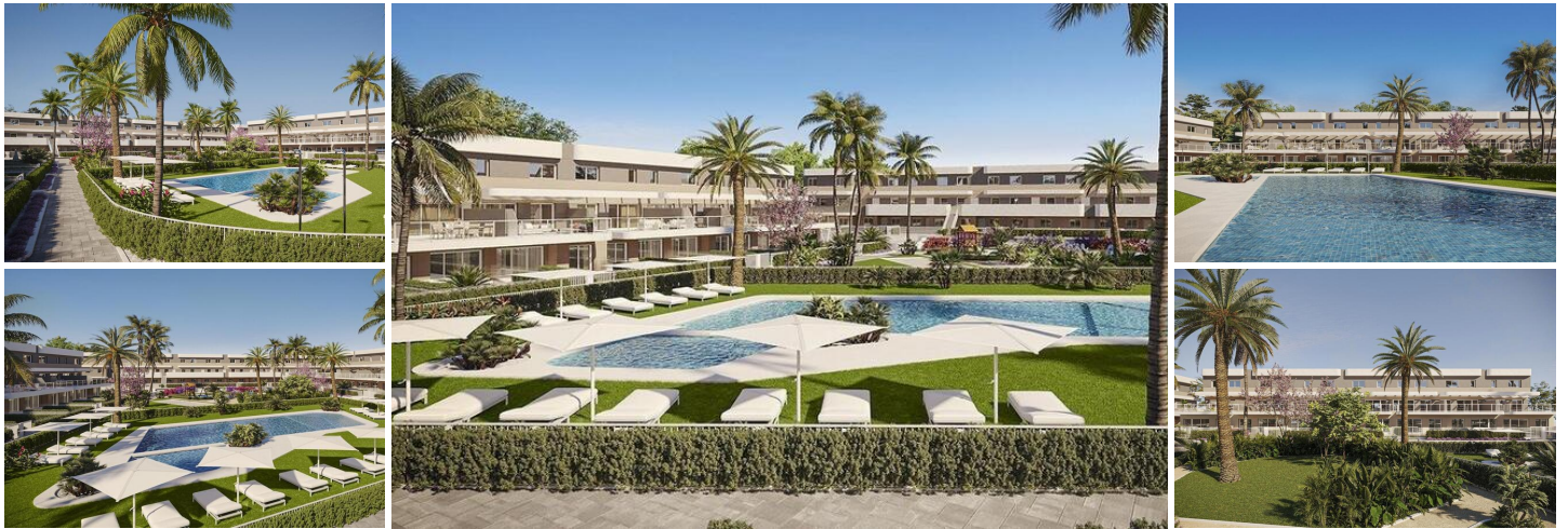
COMPLEJO RESIDENCIAL DE OBRA NUEVA EN ALENDA GOLF, ALICANTE

Promoción privada de obra nueva de bonitos apartamentos de 2 y 3 dormitorios con amplias terrazas con vistas a la bonita zona comunitaria, combina la zona tranquila del Campo de Golf de Alenda con una vida nocturna más animada en primera línea de playa fácilmente accesible en tan sólo 15 minutos.