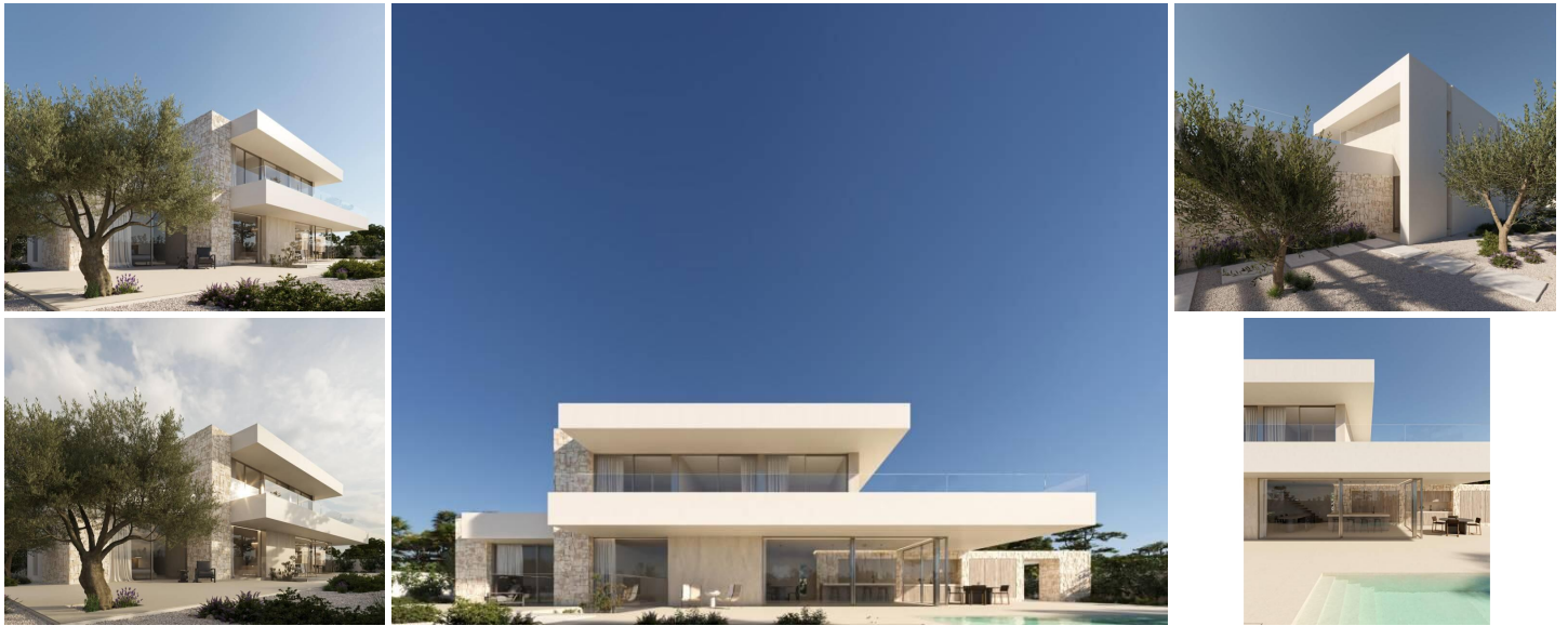
VILLA DE OBRA NUEVA EN MORAIRA

Villa de obra nueva en Moraira situada en la conocida zona de L'Andragó. Se encuentra a tan solo 350m de la cala del Andragó y a unos 200m del paseo marítimo junto a la carretera que lleva a Moraira y los diferentes comercios y restaurantes, todo muy cerca.