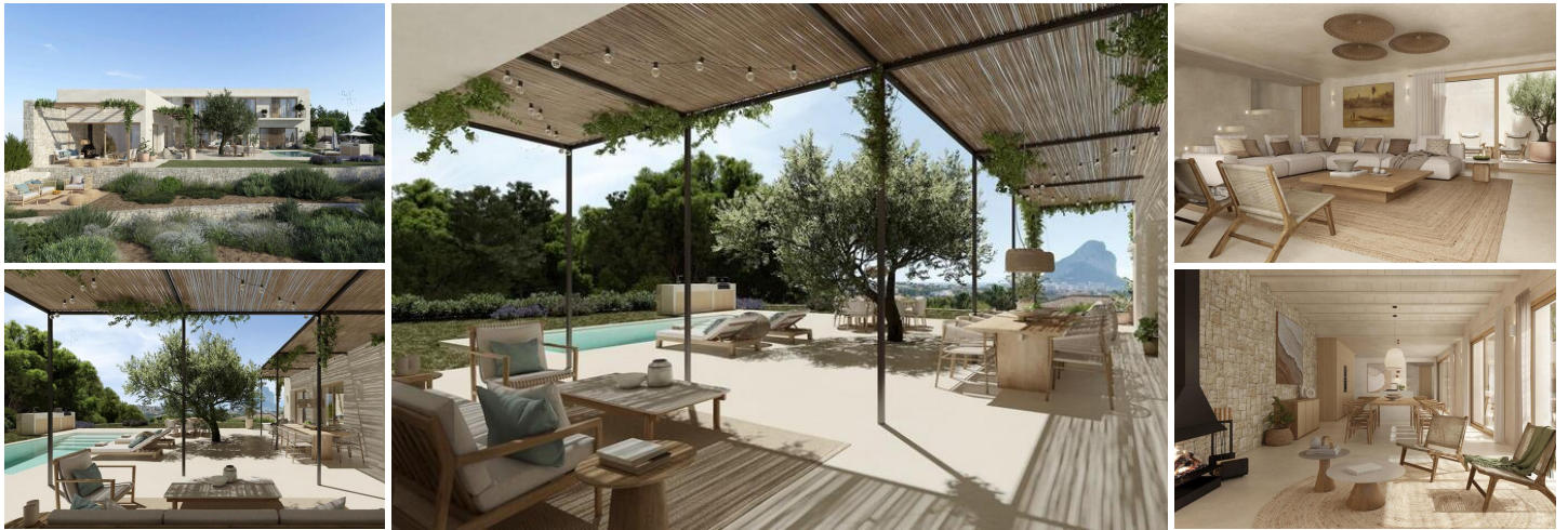
VILLA DE OBRA NUEVA EN CALPE CON VISTAS AL MAR

Villa de lujo de obra nueva situada en el límite del casco urbano de Calpe, junto a un bosque de pinos mediterráneos con vistas al Peñón, que nunca volverás a mirar igual después de conocer su leyenda. En las cálidas noches de verano, recordará esta historia y agradecerá el regalo de la vida en el Mediterráneo.