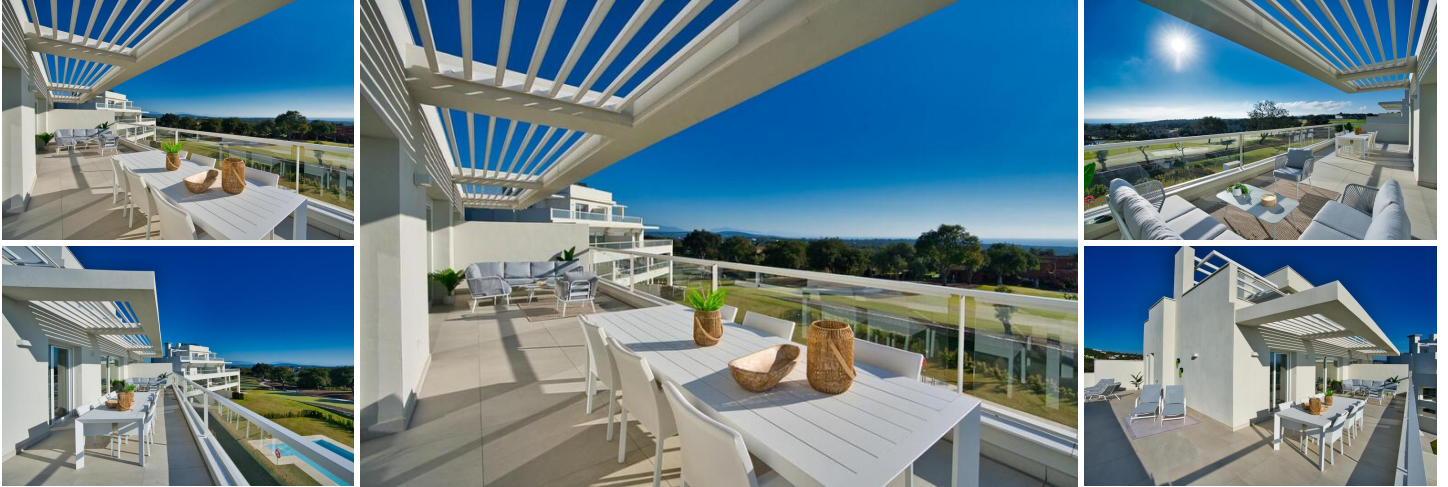
Atico de 3 Dormitorios con Vistas Impresionantes al Campo de Golf en San Roque Club, Sotogrande Alto, Cádiz

Este apartamento de tres dormitorios cuenta con impresionantes vistas al campo de golf y está situado en una ubicación idílica. Desde el momento en que entras, sentirás una fuerte conexión con la naturaleza al ser recibido por unas vistas impresionantes del campo de golf y su entorno.