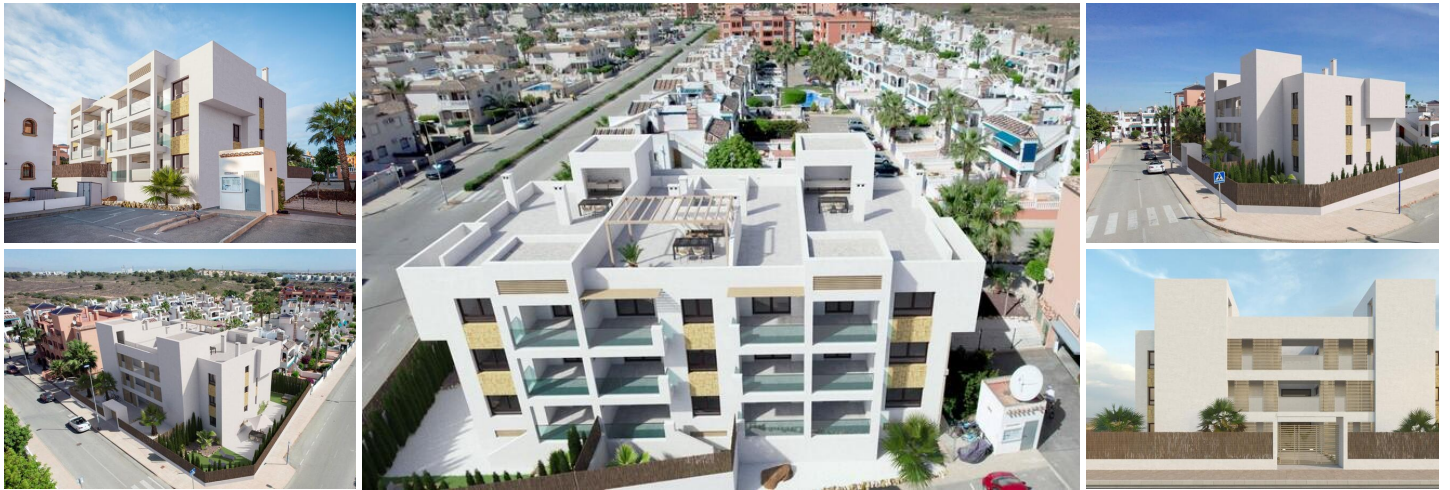
COMPLEJO RESIDENCIAL DE OBRA NUEVA EN ORIHUELA COSTA

Complejo residencial de obra nueva de estilo moderno de 12 viviendas de 2 dormitorios y 2 baños, distribuidas en tres niveles diferentes con terrazas.