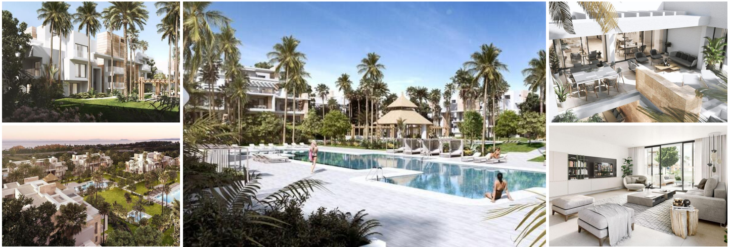
Atico de 4 dormitorios en en New Golden Mile

Descubre una exclusiva comunidad tropical compuesta por 140 residencias y áticos, que redefinen el concepto de lujo en Estepona. Este proyecto cuenta con una arquitectura icónica creada por el galardonado estudio Villarroel Torrico. Las amplias viviendas ofrecen interiores espaciosos, terrazas privadas y solárium en la azotea, brindando un estilo de vida sofisticado y relajado.