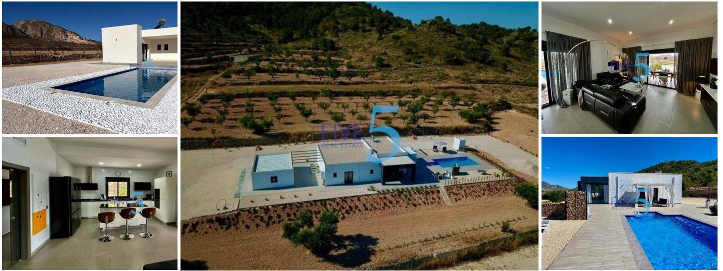
VILLA DE OBRA NUEVA EN ALBANILLA, MURCIA

Villa de obra nueva en una gran parcela en el municipio de Abanilla, provincia de Murcia.