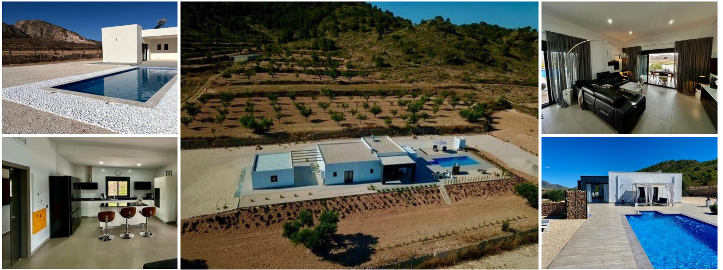
VILLA DE OBRA NUEVA EN ALBANILLA, MURCIA

Villa de obra nueva en una gran parcela en el municipio de Abanilla, provincia de Murcia.