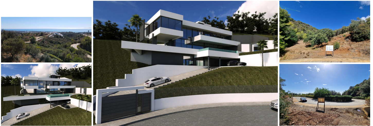
Marbella, Altos de los Monteros

¡Construya la casa de sus sueños! ... Parcela con proyecto (la licencia se está procesando) en una zona pacífica de Marbella, pero a 6-7 minutos del supermercado más nuevo de la zona y el principal hospital público, los campos de golf, la playa 3 más minutos, Marbella Center Aprox 14 minutos de distancia.-Con vistas sin obstáculos del mar junto con un atractivo proyecto de vivienda unifamiliar de 4 pisos, el permiso de construcción se está procesando y pronto se emitirá.El proyecto de construcción está incluido.