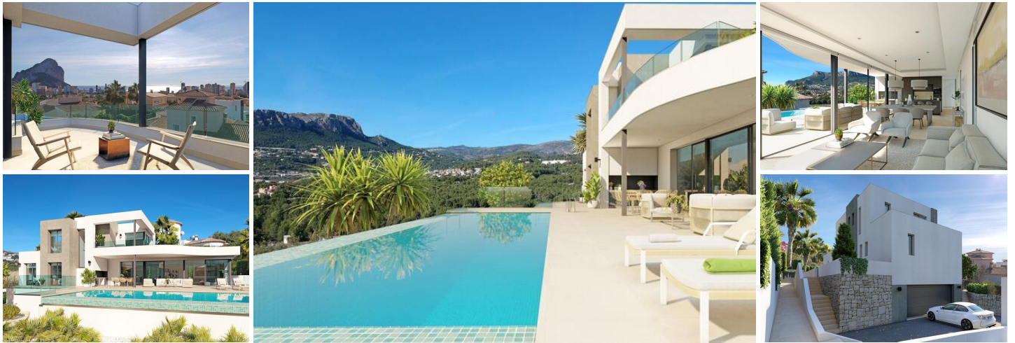
VILLA DE LUJO DE OBRA NUEVA CON VISTAS AL MAR EN CALPE

Esta villa de nueva construcción se encuentra en una ubicación privilegiada en Calpe, favorecida por sus residentes por su proximidad al centro de la ciudad, las playas, y la ubicación tranquila pero segura en las afueras de la ciudad.