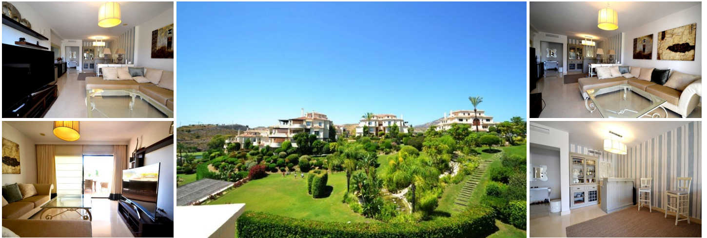
Apartamento de 3 dormitorios en Atalaya

Situado en cotizado complejo cerrado, este apartamento completamente amueblado, consta de hall, gran salón comedor con salida a terraza con orientación oeste y bonitas vistas abiertas a la piscina, jardines y montañas, cocina completamente equipada y amueblada con zona de desayuno y salida a terraza, aseo de invitados, 3 dormitorios exteriores con armarios empotrados y todos ellos con baños en suite, terraza privada desde dos de los dormitorios. El apartamento incluye dos plazas de garaje y trastero subterráneos. En complejo cerrado y privado con seguridad 24 horas, 5 piscinas exteriores, piscina interior, gimnasio, baño turco y sauna. Muy cercano a campo de golf y rodeado de toda clase de servicios, supermercados, colegios privados, etc.