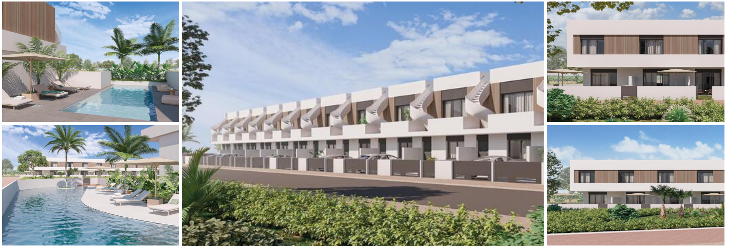
Neubau-Reihenhäuser und Eckreihenhäuser in Pilar de la Horadada

Modernes Wohnen im Herzen der Costa Blanca