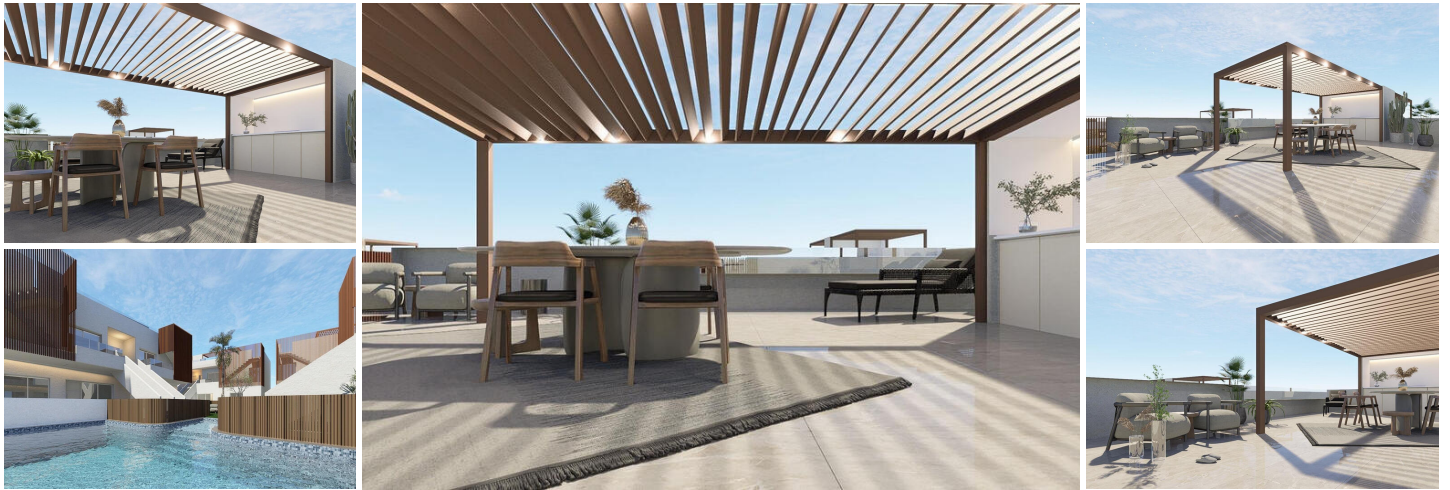
Neubau-Bungalows mit Gemeinschaftspool in Pilar de la Horadada - Costa Blanca Süd

Moderne Residenzen in der Nähe des Strandes und des Stadtzentrums