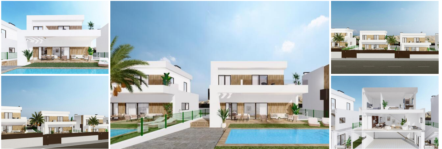
NEU GEBaute VILLEN IN FINESTRAT

Wohnanlage von modernen Villen wurde sorgfältig entworfen, um die Schönheit der Sierra Cortina und das Mittelmeer in jeder Ecke zu erfassen.