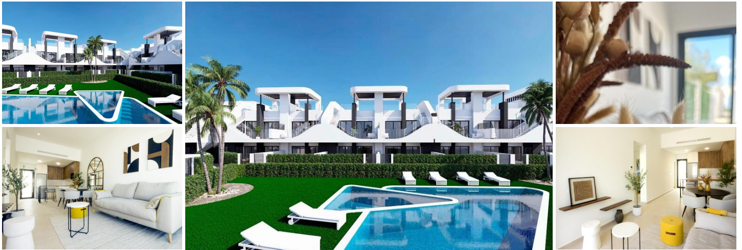
Neubau-Wohnanlage in San Fulgencio

Zeitgemäße Wohnungen mit außergewöhnlichen Eigenschaften