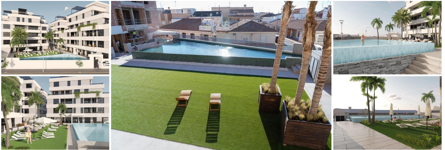
NEUBAU WOHNANLAGE IN SAN PEDRO DEL PINATAR

Neue Wohnanlage mit modernen Apartments und Penthäusern in San Pedro Del Pinatar.